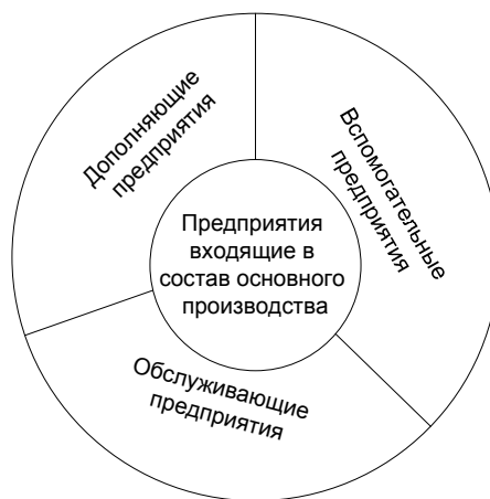
Рисунок 1. Модель кластера.

Прежде чем проводить дальнейший анализ теоретических аспектов кластерного подхода в формировании социально-экономической политики региона, считаем целесообразным дать определение термину «кластер». Согласно Портеру «кластер – это группа географически соседствующих взаимосвязанных компаний (поставщики, производители) и связанных с ними организаций (образовательные учреждения, органы государственного управления, инфраструктурные компании), действующие в определенной сфере и характеризующиеся общностью деятельности и взаимодополняющие друг друга» 1 .