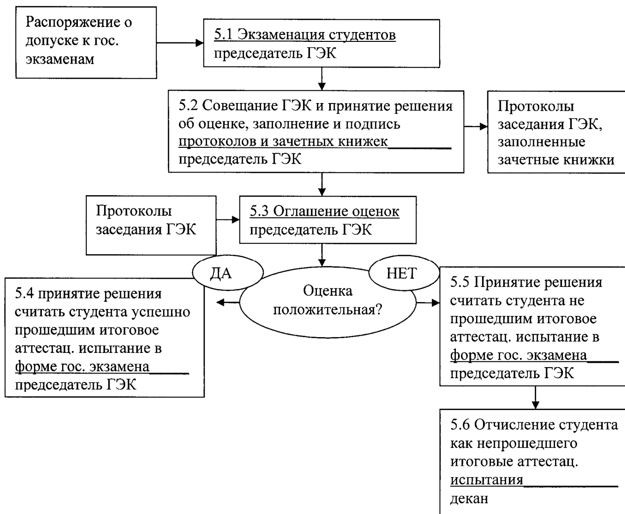
Рисунок 2 - Алгоритм подпроцесса «Проведение государственного экзамена (Заседание ГЭК)». Декомпозиция этапа 5

5.2. После окончания экзамена члены ГЭК обсуждают ответы студентов для определения уровня и соответствия подготовки студентов требованиям ГОС ВПО. После совместных дискуссий члены ГЭК принимают решение об оценке для каждого студента. Технический секретарь ГЭК вносит оценки в экзаменационную ведомость, в протоколы и зачетные книжки, члены ГЭК подписывают протоколы заседания ГЭК и соответствующие графы в зачетных книжках студентов.